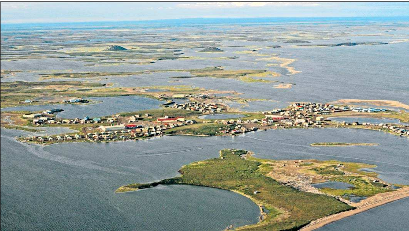
Das Ende der Welt. Jenseits von Tuktoyaktuk gibt es nichts – mit Ausnahme des Nordpols.

Auf den ersten Blick erscheint Tuktoyaktuk, was in der Sprache der Inuit „sieht aus wie ein großes Karibu“ bedeutet, wie das sprichwörtliche Ende der Welt. Viel gibt es hier nicht. Eine holperige Schotterpiste, auf der dann und wann ein kleines Flugzeug landet, ein in die Jahre gekommenes Flughafenterminal, von dem allmählich die blaue Farbe dem Rost weicht, dazu ein malerisches Hafengebiet, das nur einen paar kleinen Kuttern Platz bietet und einige, längst nicht mehr genutzte Radaranlagen der US-Amerikaner. Relikte aus der Zeit des kalten Krieges. Dazu eine handvoll Öl- und Gas-Firmen, die nach satten Gewinnen durch große Rohstoffvorkommen unter dem arktischen Eis streben, einen Polizeiposten mit vier selten genutzten Gefängniszellen und einen Friedhof, auf dem jede Beerdigung im meterdicken Permafrostboden mittels Presslufthammer zum stundenlangen Kraftakt wird. Nicht zu vergessen natürlich ein Hotel, das bei keinem Bewertungsportal im Internet geführt wird und ohnehin dort nicht auf Höchstnoten hoffen könnte. Trotz alledem stiegen in der improvisiert erscheinenden Bretterbude schon Weltstars wie Metallica oder Courtney Love ab, die einst am wohl ungewöhnlichsten Ort der Welt für ein Rockkonzert das Eis der Arktis ein wenig zum Schmelzen brachten.