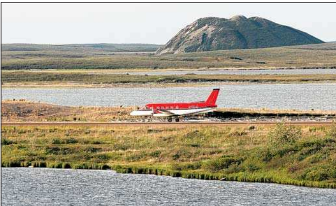
Das kleine Dorf mit den charakteristischen Pingos (linkes Foto, Hintergrund) ist im Sommer nur mit dem Flugzeug zu erreichen.