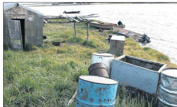
Ein Dorf am Ende der Welt. In Tuktoyaktuk geht es ruhig und beschaulich zu.

Eine Erfindung haben die Einwohner von Tuktoyaktuk allerdings gemacht, die auch bei Europäern bestens ankommt: Jedem der Touristen, die ihren Fuß ins selten über vier Grad warme Polarmeer halten, bekommen ein Diplom ausgehändigt. Im schmuckten Rahmen weist es den Besitzer als Mitglied im „Arctic Ocean Toe Dipping Club“ aus. Jenem Club, den Leute angehören, die sich vielleicht nicht getraut haben vom Muktuk zu kosten, dafür aber ihren Zeh ins kalte Eiswasser gesteckt haben.